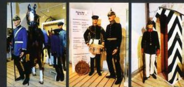
Preußische Dragoner, Pioniere und Infanterie