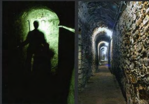
Gang unter der Zitadelle (Bastion Drusus)

Ein Rundgang durch den umlaufenden Zitadellengraben bietet ebenso Gelegenheit, Natur und Festungsbau näher kennenzulernen.